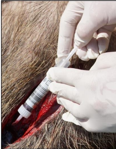
Abb. 3: Entnahme einer Serumprobe