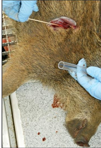
Abb. 4: Entnahme einer Tupferprobe