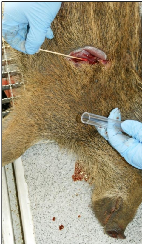
Abb. 4: Entnahme einer Tupferprobe

Um einen Seucheneintrag frühzeitig zu erkennen, ist die Beprobung tot aufgefundener Stücke und krank erlegter Tiere besonders wichtig. Diese sog. Indikatortiere müssen immer beprobt werden.