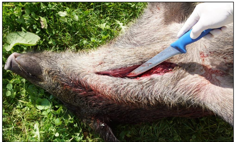
Abb. 2: Eröffnung der Halsvene mittels Längsschnitt zur Blutprobenentnahme